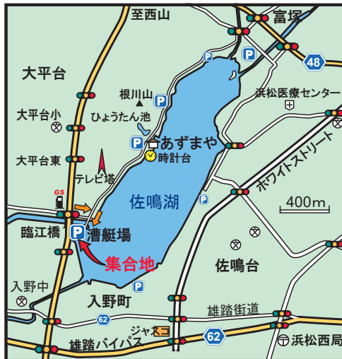
佐鳴湖漕艇場へのアクセス

伊吹山写真(伊吹山バスツアーでは山頂駐車場等でイヌワシや伊吹の名の付いた花などを観察します。)