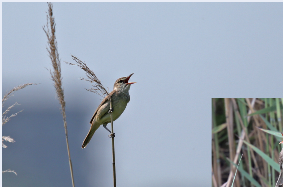
穂先で勢いよく囀るオオヨシキリ