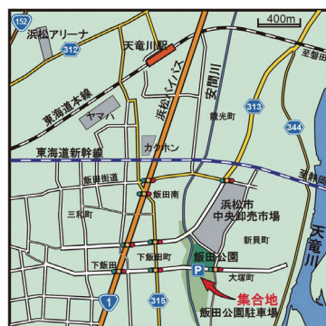
飯田公園(みどり～な)へのアクセス