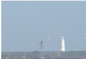
コアジサシの群れ