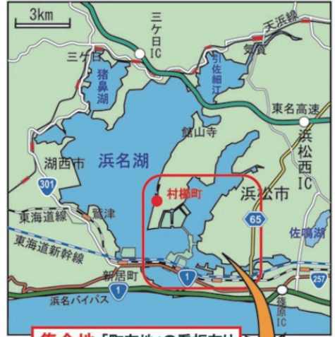
集落地「町有地」の看板有り