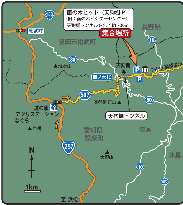
面の木へのアクセス