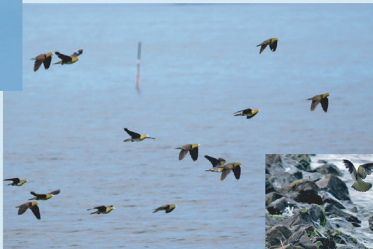
湖面を飛ぶアオバトの群れ。