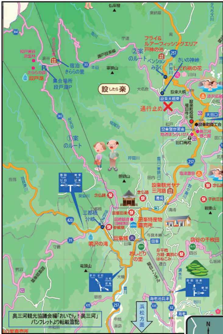
段戸湖へのアクセス