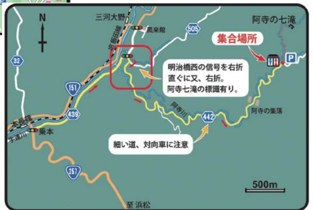
阿寺の七滝へのアクセス