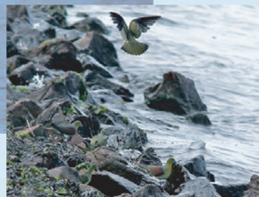
海水を飲みに来たアオバト達。

「今、村櫛海岸に行けばアオバトがみられるよ。」と野鳥の会の先輩から教わり簡単な地図も書いてもらった。以来、夏の村櫛海岸に14年通っている。最も出会える時間帯は、お天気のよい早朝から10時頃。通って何日目かで、ついに初めてアオバトを見ることができた。